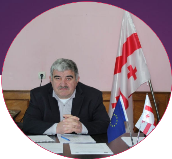
კორნელი სალია საკრებულოს თავმჯდომარე

2023 წელს ჩატარდა საკრებულოს 21 სხდომა, აქედან 12 მორიგი და 9 რიგგარეშე, სადაც მიღებულ იქნა სამართლებრივი აქტები: დადგენილება 45 და განკარგულება 43